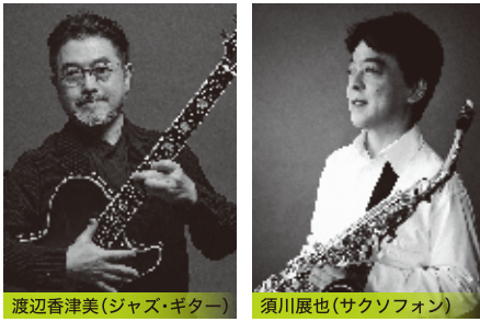
渡辺香津美(ジャズ・ギター) 須川展也(サクソフォン)

日本が世界に誇る二人の巨匠、トップ・ジャズ・ギタリスト渡辺香津美とクラシカル・サクソフォンのトップスター須川展也によるコンサートがミュージコで実現。ベースには、日本屈指のジャズ・ベーシスト井上陽介が加わり、スタンダードな名曲を中心にこの日しか聴けない大人ムードあふれる特別なライブをお届けします！極上のジャズライブをご堪能ください。